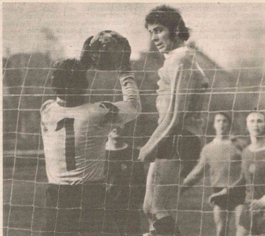
Der Sömmerdaer Weise ist zum Kopfball hochgestiegen, doch Erfurts Torhüter Müller hat aufgepaßt. Eine Szene aus Zentronik Sömmerda gegen UT Erfurt 2:1.