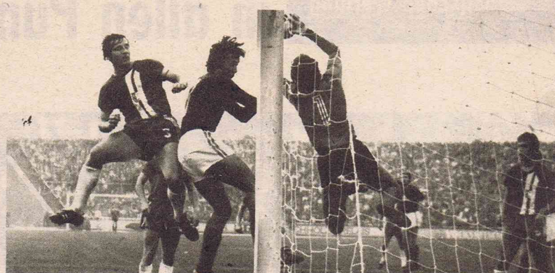
Kopfballstärke war auch in der vergangenen Saison wieder eines der typischen Merkmale des Magdeburgers Zapf. Creydt (BFC) meistert den Ball jedoch. In der Mitte Jonelat