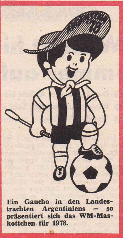
Ein Gaucho in den Landestrachten Argentiniens - so präsentiert sich das WM-Maskottchen für 1978.

Absteiger aus der ungarischen Oberliga sind BTC Salgotarjan und Banyasz Dorog.